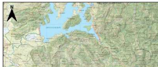
Foto 2. Localización de la finca