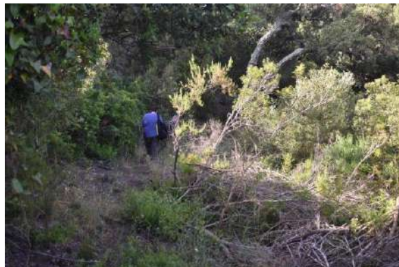
Foto 6. Visibilidad media del trazado

Hacia el oeste desde el camino, al incorporarnos al tramo sur, se podía apreciar la cueva de La Herriza, un abrigo con manifestaciones pictóricas rupestres, actualmente en fase de investigación, pero que pone de relieve la importancia estratégica de la zona para las comunidades de cazadores-recolectores paleolíticos. También, junto a la cueva, se documenta la existencia de un poblado prerromano del mismo nombre.