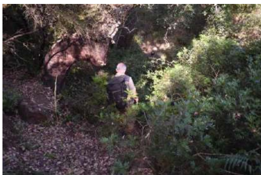
Foto 5. Zonas de menor claridad

En algunos tramos la vegetación se hace más densa, invadiendo el camino, pero también hay tramos con más claridad (Figs. 5 y 6).