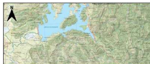
Foto 2. Localización de la finca