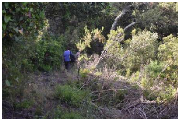
Foto 6. Visibilidad media del trazado

Hacia el oeste desde el camino, al incorporarnos al tramo sur, se podía apreciar la cueva de La Herriza, un abrigo con manifestaciones pictóricas rupestres, actualmente en fase de investigación, pero que pone de relieve la importancia estratégica de la zona para las comunidades de cazadores-recolectores paleolíticos. También, junto a la cueva, se documenta la existencia de un poblado prerromano del mismo nombre.