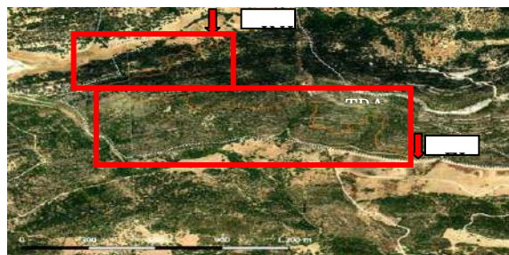
Foto 3. Trazado del camino.

La prospección se llevó a cabo el día 28 de mayo, durante una jornada completa, y se supervisó todo el trazado del camino, desde el principio hasta el final, según planimetrías aportadas por la Dirección Facultativa, y que han servido para la elaboración de este informe. El trazado podría dividirse en 2 tramos diferenciados. Uno, desde el comienzo hasta que el camino gira hacia dirección oeste, y el segundo, desde ese punto hasta la finalización. Esto es, la ladera norte del monte donde se propone el trazado –la umbría-, y la ladera sur (Fig. 3).