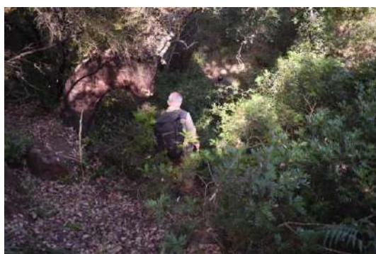
Foto 5. Zonas de menor claridad

En algunos tramos la vegetación se hace más densa, invadiendo el camino, pero también hay tramos con más claridad (Figs. 5 y 6).