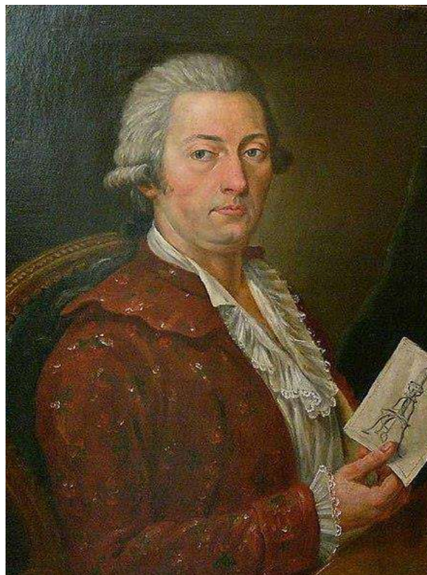
Foto 2. Carl Wilhem Scheele (1742-1786). Alrededor de 1775. Lienzo sobre óleo. Hacia 1775. Dominio público.