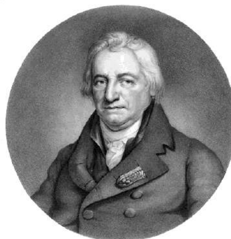
Foto 3. Claude Louis Berthollet (1748-1822). Grabado anónimo.

El blanqueamiento del hilado de algodón fue debatido en junta el 18 de abril de 1782, donde se convino «facilitar el mejor orden en el blanqueo del hilo de la Escuela Patriótica de hilados [...] el decano de Industria pediría a otras Sociedades informes e instrucciones para lograr superar el atraso que tenía la clase de industria de Sanlúcar» 7 . Cabe colegir las contrariedades que estaban produciendo las obsoletas técnicas de fabricación, que mermaban la calidad del producto final. El 3 de junio, la junta de industria emitió un memorial en el que: