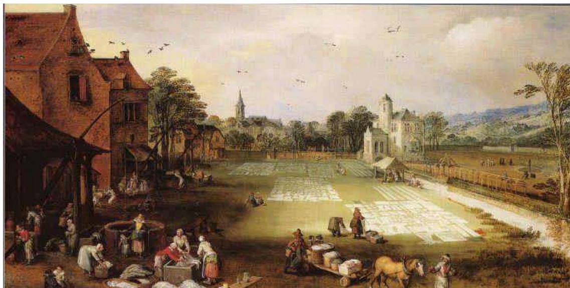
Foto 1. Blanqueamiento de tierra . Óleo sobre tabla. Jan Brueghel el Joven y Joos de Momper el Joven. Entre 1625 y 1635. Dominio público.

finales de febrero de 1785, experimento de análisis y síntesis del agua anunciado públicamente en un trabajo leído ante la Academia de Ciencias de París. Si bien, ya había sido descubierto en 1774 por el químico sueco Karl Wilhem Scheelle, que explicaba su particular naturaleza de destruir el color de la materia vegetal, Berthollet recogió este gas extremadamente tóxico en un medio alcalino para formar el hipoclorito llamado « Eau de Javelle », (agua de lejía) en recuerdo de la factoría cercana a París que la elaboró (Javel). En 1798, la lejía sólida o « bleaching powder », depurada por Charles Tennat en la fábrica de St. Rollox en Glasgow, provocaba la reacción del gas con hidróxido cálcico para obtener un compuesto de transporte y uso más accesible 2 .