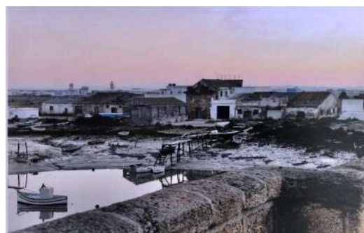
Figura 5. Vista del Real Carenero de mediados del S. XX.

No obstante, dadas las características arquitectónicas, pero sobre todo históricas, el conocido como Sitio Histórico del Puente Suazo el 29 de noviembre de 1996 es declarado Bien de Interés Cultural (BIC), que al menos lo salva de la posible actuación de la piqueta .