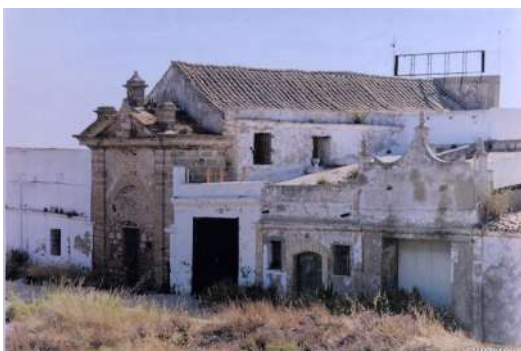
Figura 4. Vista del Real Carenero de mediados del S. XX.

Una nueva epidemia de fiebre amarilla se declara en 1919, esto obliga a las autoridades sanitarias de San Fernando a adecuar dos inmuebles donde establecer, entre los meses de