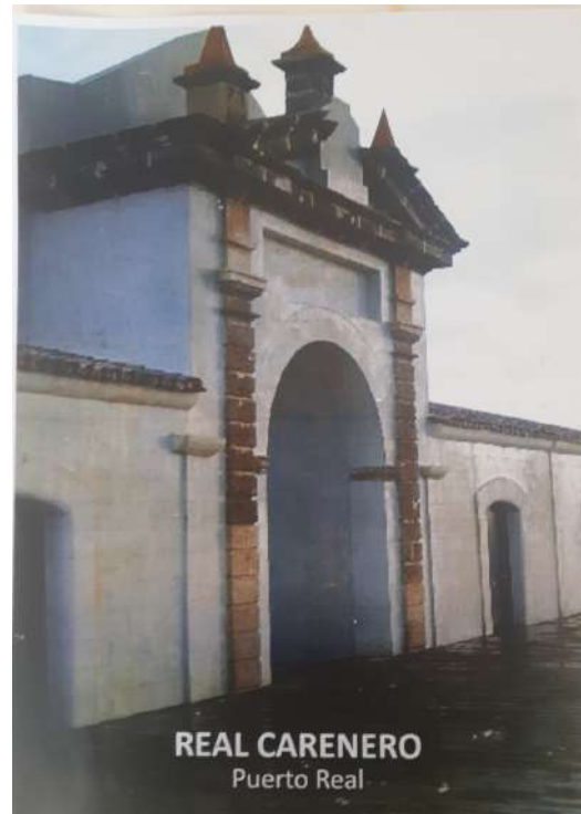
Figura 1. Fachada anterior de la iglesia del Real Carenero.

ligado a la historia naval de San Fernando.