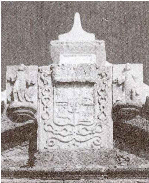
Figura 2. Escudo borbónico que estuvo instalado en el frontispicio de la puerta de la iglesia del Real Carenero.

Este luctuoso hecho da lugar a la entronización en España de la dinastía borbónica al jurar como rey ante las Cortes Castellanas en 1701, el hijo del Gran Delfín de Francia, Felipe, duque de Anjou, dando lugar con ello al inicio de la Guerra de Sucesión española (1701-1713) frente a los partidarios del Archiduque Carlos de Austria, igualmente aspirante a ocupar el trono español.