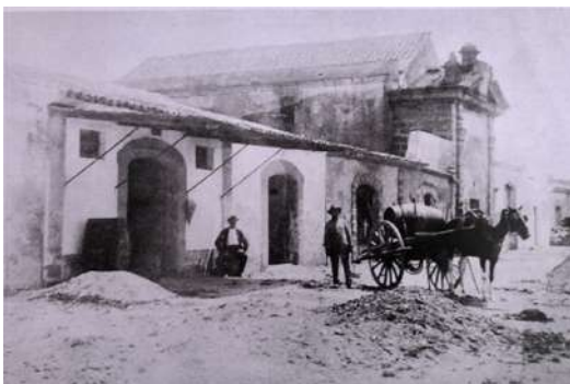
Figura 3. Vista de las naves del Real Carenero, ocupadas por los almacenes de la Fábrica de Aguardiente La Esperanza de San Fernando. Principio del S. XX.

vulcanizado, un almacén perteneciente a la fábrica de aguardiente “La Esperanza” situada en la actual calle Hernán Cortés de San Fernando, cercana al Carenero, un restaurante de nombre El Inesperado e incluso dos casas de citas, una de ellas con el nombre de <<La Medallona>>, nombre debido a una gran medalla con la que se engalanaba su propietaria. Documentos fotográficos nos muestran una deterioradas instalaciones que sirven de amarres de pequeñas embarcaciones.