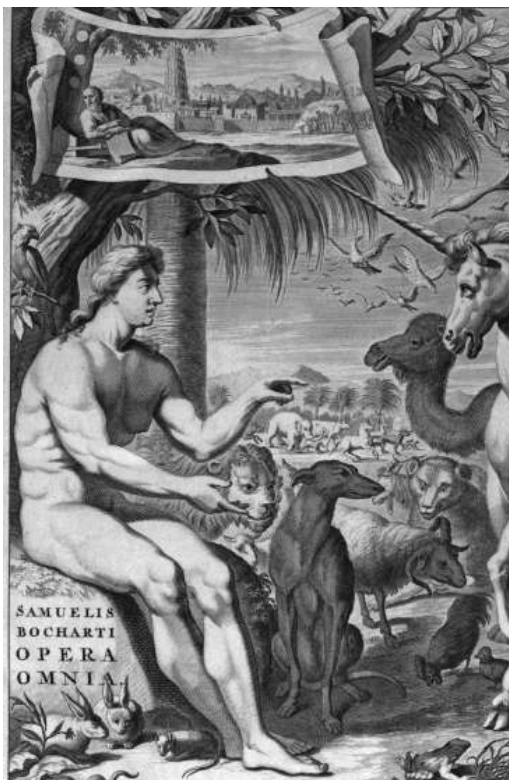
Figura 1. Lámina inicial de la obra Opera Omnia Geographia Sacra seu Phaleg et Canaan . En línea en:

Ya fuera de nuestras fronteras, concretamente en Francia, es el teólogo Samuel Bochart (1599-1667) el que en 1646 da buena cuenta de la situación de Carteia, en su obra Opera Omnia Geographia Sacra seu Phaleg et Canaan. , en la que muestra una geografía sacra basada en textos clásicos latinos y griegos. Bochart, erudito de la escuela protestante bíblica, nacido en Francia fue un anticuario muy interesado en la interpretación de los clásicos, y en esta línea nos encontramos con referencias a la ciudad en cuanto a su situación en las columnas de Hércules y sobre su confusión con Tartessos 33 . En su obra creo una historia bíblica en la que profundizó en el origen de las naciones, tras la dispersión de los hijos de Noé 34 y es en este punto de la dispersión y