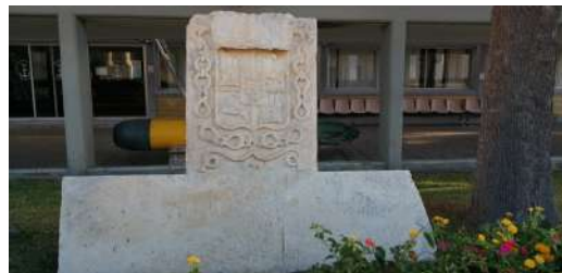
Figura 6. Escudo borbónico sobre lápida con inscripción ilegible, situado en el jardín del edificio Almirante Diego Brochero de la Escuela de Suboficiales de la Armada en San Fernando (Cádiz).

encuentran, perfectamente conservadas, sirviendo de ornato en los jardines del edificio “Almirante Diego Brochero” cercanos a la Escuela de Suboficiales de la Armada. En cuanto a las pequeñas figuras, perfectamente recuperadas, se encuentran en el actual Ayuntamiento, provisional, de la ciudad.