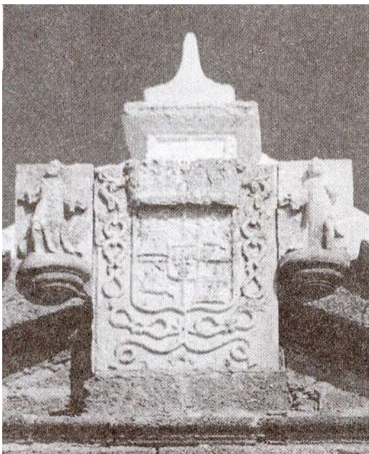
Figura 2. Escudo borbónico que estuvo instalado en el frontispicio de la puerta de la iglesia del Real Carenero.

Este luctuoso hecho da lugar a la entronización en España de la dinastía borbónica al jurar como rey ante las Cortes Castellanas en 1701, el hijo del Gran Delfín de Francia, Felipe, duque de Anjou, dando lugar con ello al inicio de la Guerra de Sucesión española (1701-1713) frente a los partidarios del Archiduque Carlos de Austria, igualmente aspirante a ocupar el trono español.