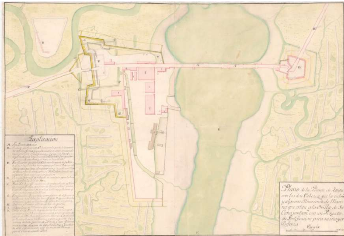
Figura 7. Plano del puente Suazo en Cádiz con los reductos situados en sus entradas. 1724. (C.G.E., 957).

“Plano de la Puente de Suazo con las dos Cabezas que la cubren y algunos Almacenes de Marina que están a la Orilla de su Caño juntamente con un Proyecto de Fortificación para su mayor Defenza.