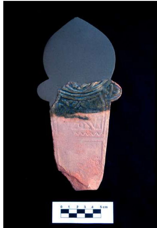
Lám. 5.- Reconstrucción de una de las estelas halladas en Algeciras.