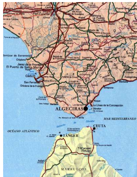
Figura 1. Situación de Algeciras en la región del Estrecho de Gibraltar.