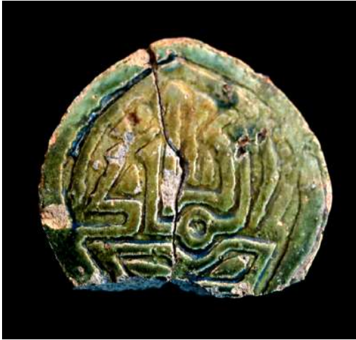
Lám. 19.- Estela con motivo decorativo epigráfico ( al-mulk = el poder).

Michel-Rolph Trouillot. Boston, Mass.: Beacon Press.