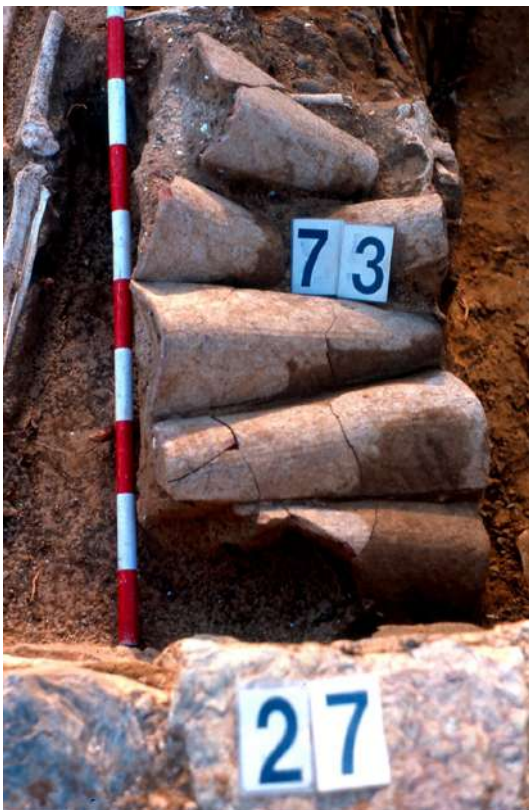
Lám. 4.- Tumba con cubierta de tejas.