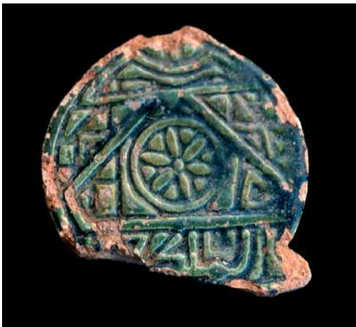
Lám. 20.- Estela con motivo decorativo epigráfico ( al-mulk li-llah = el poder es de Dios).

Vincent, C. (1801). Précis des principaux événements de Saint-Domingue.