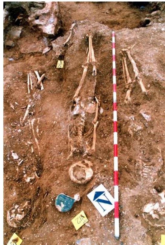
Lám. 2.- Sepultura con estela funeraria en la cabecera.