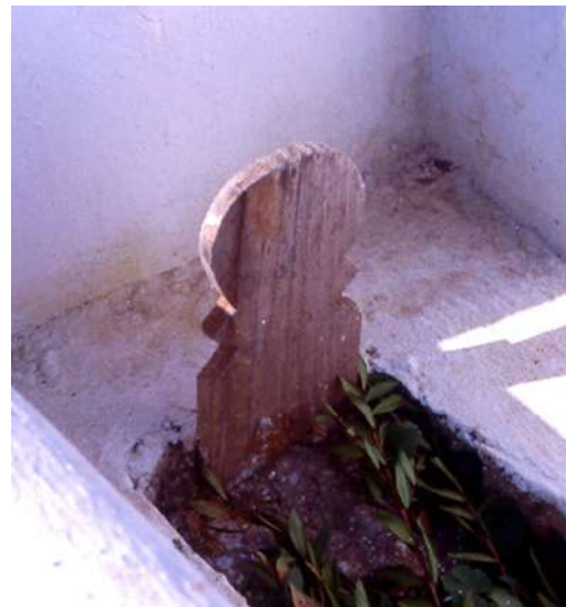
Lám. 1. Estela funeraria de madera en el actual cementerio de Tetuán similar en forma y tamaño a las algecireñas.