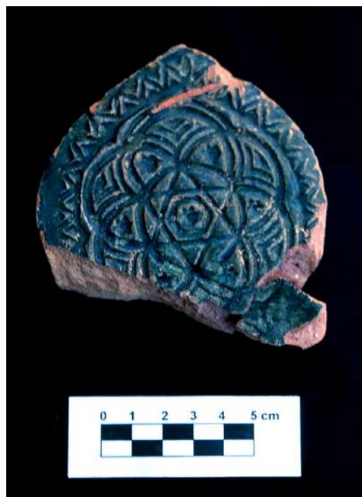
Lám. 6, 7 y 8.- Peanas de estelas funerarias con motivos estampillados variados. Algunas con orejetas.