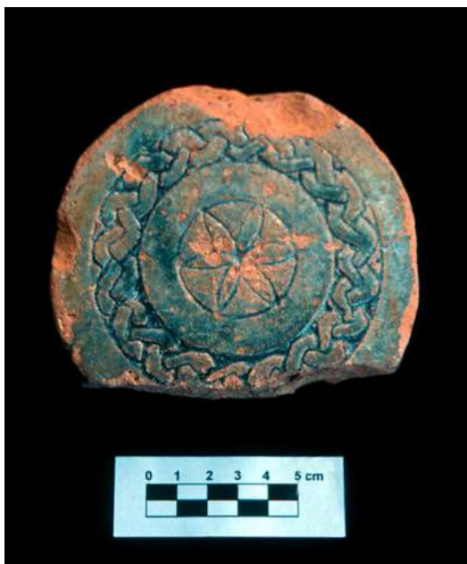
Lám. 15.- Estela con el "Cordón de la Eternidad" que rodea un motivo fitomorfo hexapétalo.