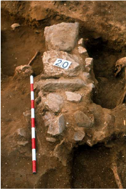
Lám. 3.- Tumba con cubierta de lajas de piedra.