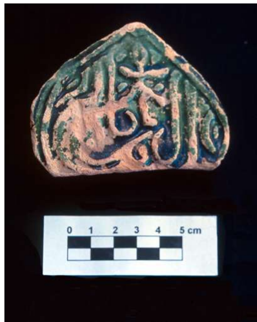
Lám. 18.- Estela con motivo decorativo epigráfico ( al-yumn = la felicidad).