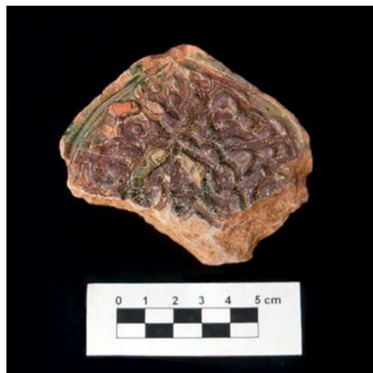
Lám. 16 y 17.- Estelas con decoración de tipo vegetal estilizado.