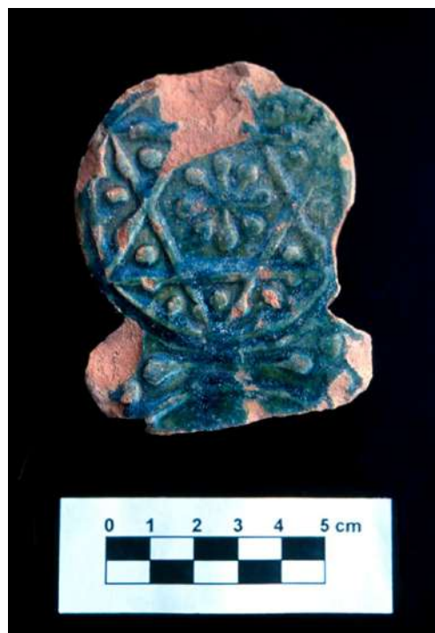
Lám. 9, 10, 11 y 12, - Estelas con decoración geométrica (cuatro y siete circunferencias que se cortan).