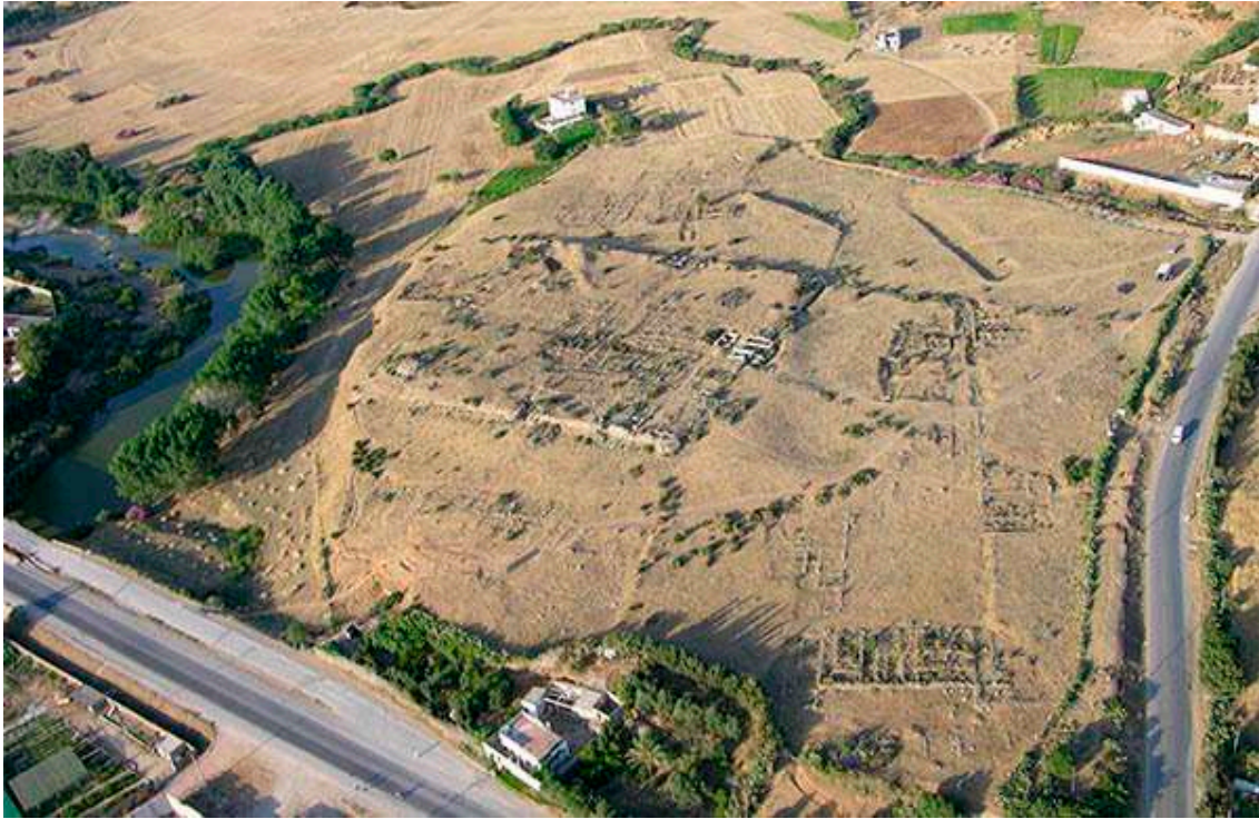
Figura 1. Yacimiento arqueológico de Tamuda. Vista aérea

Uno de los retos de la aglomeración urbana de Tetuán es, precisamente, el de transformarse en una ciudad dinámica, que acomode su capacidad económica con el potencial de sus recursos turísticos, culturales (no en vano la Medina de Tetuán es Patrimonio de la Humanidad), paisajísticos, medioambientales, apoyados en la relación ciudad-entorno, con el mayor respeto a la potencialidad medioambiental de la zona. Para ello, y de cara a la atracción de un turismo de carácter cultural, la oportunidad de contar con el complejo arqueológico y patrimonial de Tamuda (siendo la antigua ciudad fenicio-mauritana y el posterior enclave fortificado romano las facies arqueológicas más relevantes del sitio) resulta un factor clave para la articulación integral de actividades ajustándose a la capacidad de acogida del territorio y a los intereses de un turista cultural que pueda sentirse atraído no sólo por los atractivos,