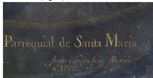
Figura 2. Andrés López, Dolorosa (detalle de la firma), 1783, Iglesia Mayor de Sanlúcar.

conserva una fotografía del dorso de la obra, que nos permite verificar su existencia (fig. 5).