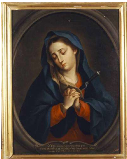
Figura 3. Andrés López, Dolorosa , 1783, Museo de América (Madrid).

se representa a la Virgen de medio cuerpo, vestida de rojo, con una toca cruda y un manto azul.