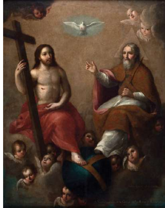
Figura 8. Andrés López, Santísima Trinidad , 1783, Colección particular.