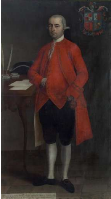
Figura 7. Andrés López, Retrato de Don Francisco Páez de la Cadena Ponce de León y Pavón , 1768, Museo de América (Madrid).