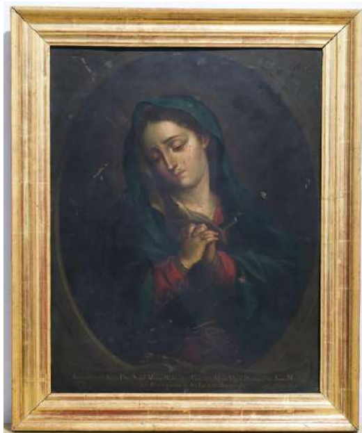
Figura 1. Andrés López, Dolorosa , 1783, Iglesia Mayor de Sanlúcar de Barrameda.

La segunda pintura es otra Dolorosa , en este caso realizada al óleo sobre lienzo, de 70,5 x 60 cm y que se conserva en el Hospital de San Juan de Dios, de Cádiz (fig. 4). La obra, propiedad de la Hermandad de la Santa Caridad y que ha estado en la iglesia del hospital hasta tiempo reciente, actualmente se ubica en las dependencias adyacentes, usadas como museo. Hace unos años el lienzo fue restaurado, sufriendo un reentelado que ha ocultado las palabras que tenía pintadas en su reverso y que decían lo siguiente: “Mandó pintar esta ymagen de Dolores, para su prima Doña Eduarda Pichardo, Don Miguel Páez de la Cadena; Caballero Pensionista de la Real y Distinguida Orden Española de Carlos Tercero, en México a 1º de abril de 1790”. 3 A pesar de ello, la hermandad