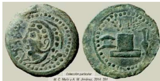
Figura 10. Lascuta