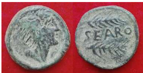
Figura 12. Searo