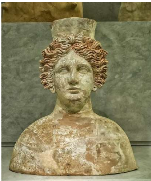
Figura 2. Imagen de la diosa Tanit representada en un busto de la diosa, realizado en terracota y encontrado en las excavaciones de la necrópolis de Puig de Molins, en Ibiza. Por el lugar donde aparece, una necrópolis, podemos ver reflejado el poder de esta diosa en el mundo de la muerte.

deidad de la diosa, podemos hacernos una idea de la importancia que esta tuvo en el mundo púnico, tanto en el de los vivos como en el de los muertos.