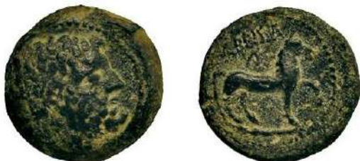
Figura 17. Imagen de la cuarta y última moneda que acuña Lebrija. Se puede apreciar un perfeccionamiento en su fabricación que no pudimos ver en las acuñaciones anteriores. Al igual que las otras dos monedas anteriores, tanto la imagen del anverso como la del reverso están rodeadas de una grafila de puntos.

estaba en buenas condiciones para su interpretación.