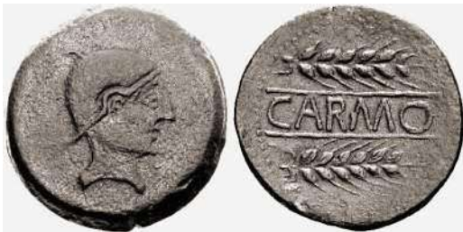
Figura 5. Carmo