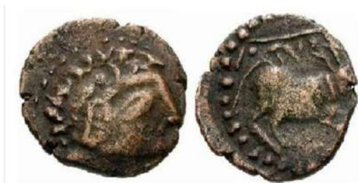
Figura 14. Moneda acuñada en Lebrija en el siglo III a. de C. Se aprecia la cabeza tosca en anverso y el toro y leyenda en el reverso

En cuanto a la métrica de esta primera moneda, tiene un peso medio aproximado de 4 gramos, 15 milímetros de diámetro y su valor sería de un semis o porción del agoráh en el sistema púnico. El semis como fracción de una unidad monetaria se introduce ya dentro de la métrica romana, por lo que es poco probable que ese fuese su nombre, pudiendo ser el de “mitad”, haciendo referencia al agoráh como unidad.