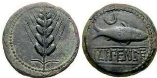
Figura 7. Ilipa Magna