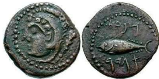
Figura 11. Gades