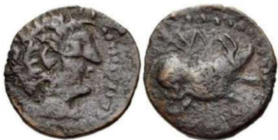
Figura 16. Esta moneda es igual que la anterior, tanto la figura humana del anverso, como la imagen del toro del reverso son las mismas, la variación entre ambas está en la leyenda, aunque en las dos la leyenda está en latín y representan la sílaba NA, en esta ocasión el último palo de la N es el primero de la A.

La última acuñación que se hace en la Lebrija romana data del año 50 d. de C. aproximadamente, se puede decir con bastante seguridad, que es el único documento u objeto de la época en el que aparece epigráficamente el nombre de Lebrija en época romana, Nabrisa.