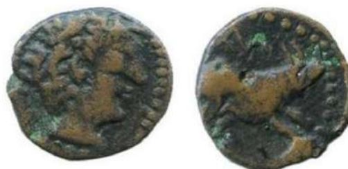
Figura 15. Imagen de una moneda acuñada en Lebrija en el siglo I a. de C. Ya se aprecia la leyenda latina, con la sílaba NA, donde la letra A está representada dentro del arco de la letra N. Tanto la figura del anverso, como la del reverso, están rodeadas de una grafila de puntos.

Lo cierto es que resulta difícil poder aclarar estas incógnitas debido a la poca información que se tiene de esa época.