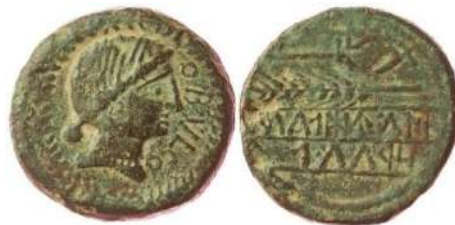
Figura 9. Obulco