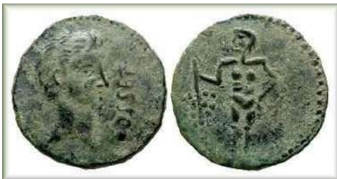
Figura 6. Osset