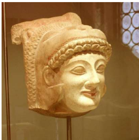
Figura 3. Representación del dios Melqart obtenida de un busto de piedra caliza pintada, aunque haya perdido su coloración, del siglo V a. de C. que fue encontrada en Chipre. Actualmente su ubicación es el Museo Barracco en Roma.

como protector de la navegación), aras o pórticos que representaban al templo que desde tiempos fenicios se levantaba en Cádiz (Gadir fenicia) en honor a este dios. La piel de león hace referencia a la piel con la que se cubría este dios y que adquirió después de cumplir una de las doce pruebas que tuvo que realizar por mandato de Zeus, matar al león de Medea.