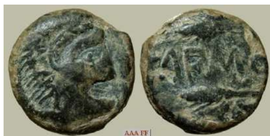
Figura 13. Carmo

En las monedas que nos ocupa, las que acuñó Lebrija, aparecen a lo largo del tiempo distintas iconografías que representan a los diferentes dioses mencionados anteriormente.