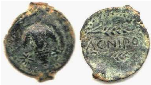
Figura 4. Acinipo