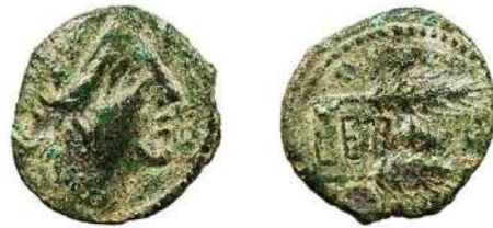
Figura 8. Cerit